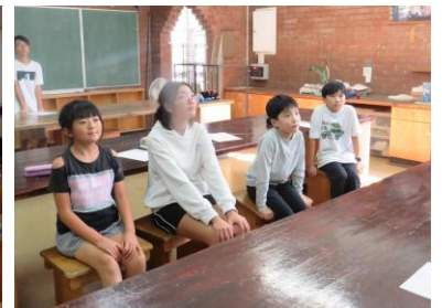
行事委員会の活動の様子