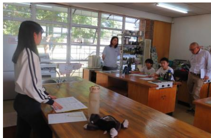
学級委員会の活動の様子