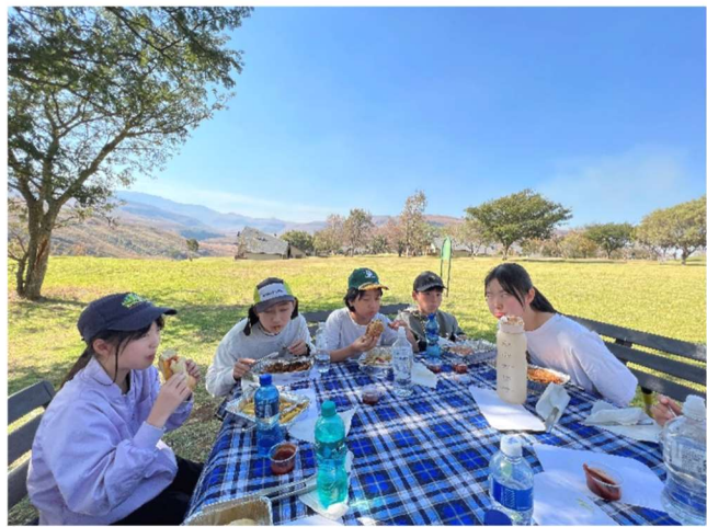
最高の景色と、おいしいお昼ご飯でした。