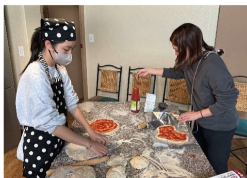
夕食のピザをみんなで作りました。