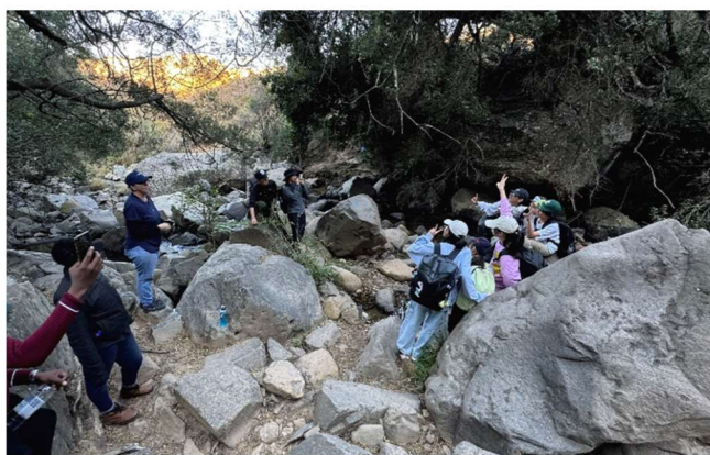
ハイキングコースの途中にある滝をバックに。