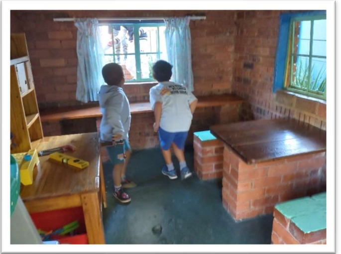
遊びはじめると、あっという間に仲良くなりました！