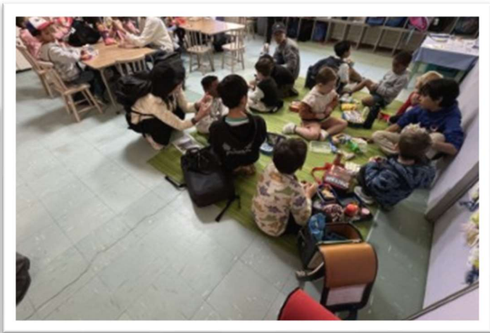
幼稚園の先生方も一緒に体験してくださいました。