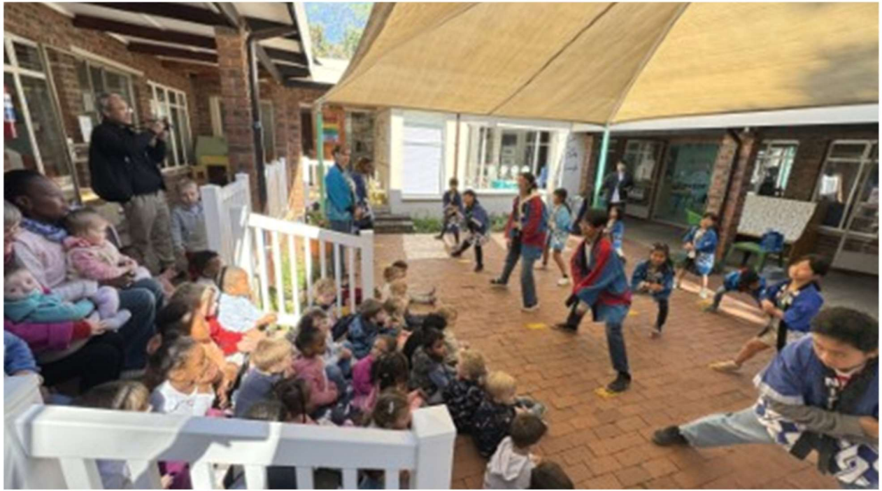
ヨハネスソーランを披露！そして一緒に踊りました。