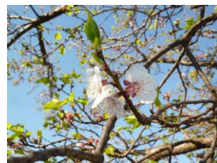
【アプリコット(あんず)の花】

8月の声を聴くと同時に、朝夕の寒さが和らぎ、春の兆しを感じるようになりました。学校においては、プール横のアプリコット（あんず）の木に正に梅の花の如し、可憐な花が咲き始めました。池の周りのシャリンバイにも可愛いピンクの花が付き始めました。